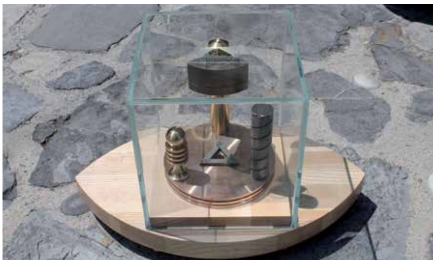
Generator biopolja Oka je dosegljiv na Misteriji.si.

Idealno bi bilo, če bi lahko medicinsko terapijo izvajali v poljih višjih duhovnih svetov, da bi bile bolnišnice v takih poljih. Takšno polje ni težko vzpostaviti. Ustvarimo jih lahko naravno ali pa umetno – z generatorjem biopolja Oka, ki človeka prestavi v višja duhovna stanja, ga