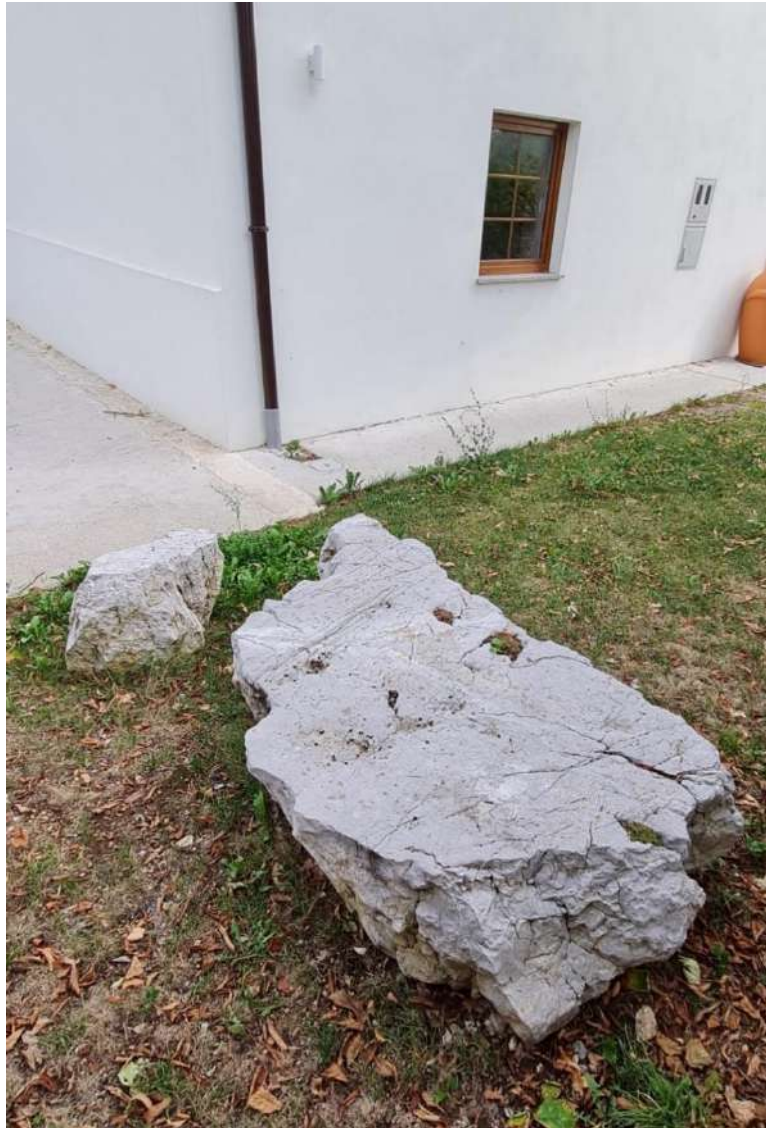
Slika 9: Manjša skala dvojnika, ki je v znamenju ognja, se povezuje z vogalom hiše. V vogal je vgrajen vogalni binkl, postavljen na živi skali v znamenju vode.

povezavo med obema skalama, vžge dvojniki, ta pa se poveže z izvorom moči v hiši. Povezava se vzpostavi s kačjo črto široko pol metra.