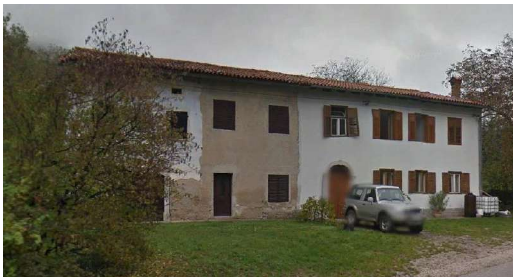
Slika 4: Po drugi svetovni vojni je bila notranjost hiše razdeljena na dva ločena dela.

Po drugi svetovni vojni je hiša dobila dva lastnika, ki nista bila v sorodu, zato so prej enovito stavbo razdelili na dvoje. To ni bila le razdelitev lastnine v zemljiški knjigi, razdelili so jo tudi v naravi. Zazidali so vse prehode med obema deloma hiše. Oba dela stavbe sta bila ločena in med njima ni bilo notranjih povezav z vrati.