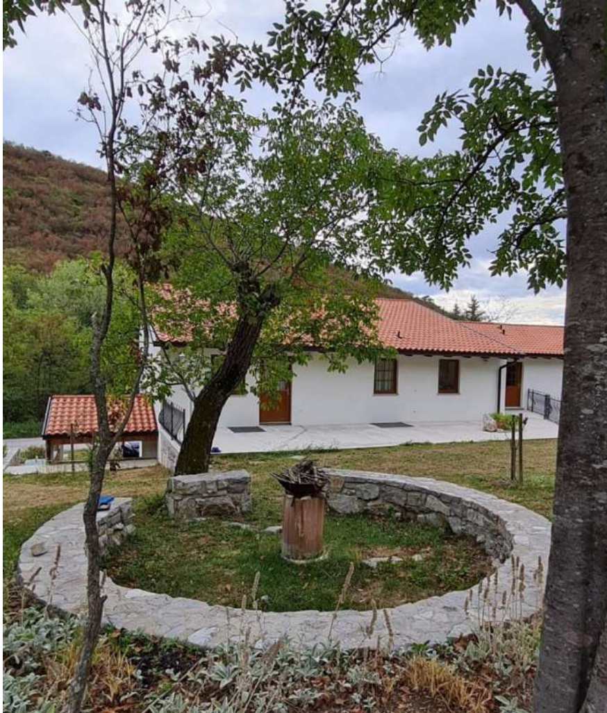
Slika 8: Na obsekanem orehu, ki raste na kačji črti, so vidni bujni poganjki.

Da drevesa bujno rastejo na kačjih črtah lahko opazimo tudi drugod v naravi. Takšna drevesa so občutno debelejša od sosednjih dreves, ki rastejo v bližini, vendar ne na kačji črti.