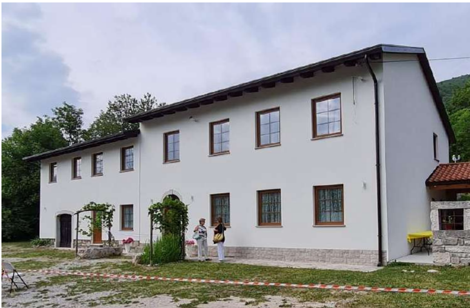
Slika 5: Hiša po končani obnovi in vnovični povezavi obeh delov v celoto.

Ustanova Zdenke Gustinčič je leta 2016 kupila prvi del hiše, leta 2018 še drugega. Začeli so z obnovo in jo končali spomladi 2020. Kakšna je hiša danes vidimo na sliki 5.