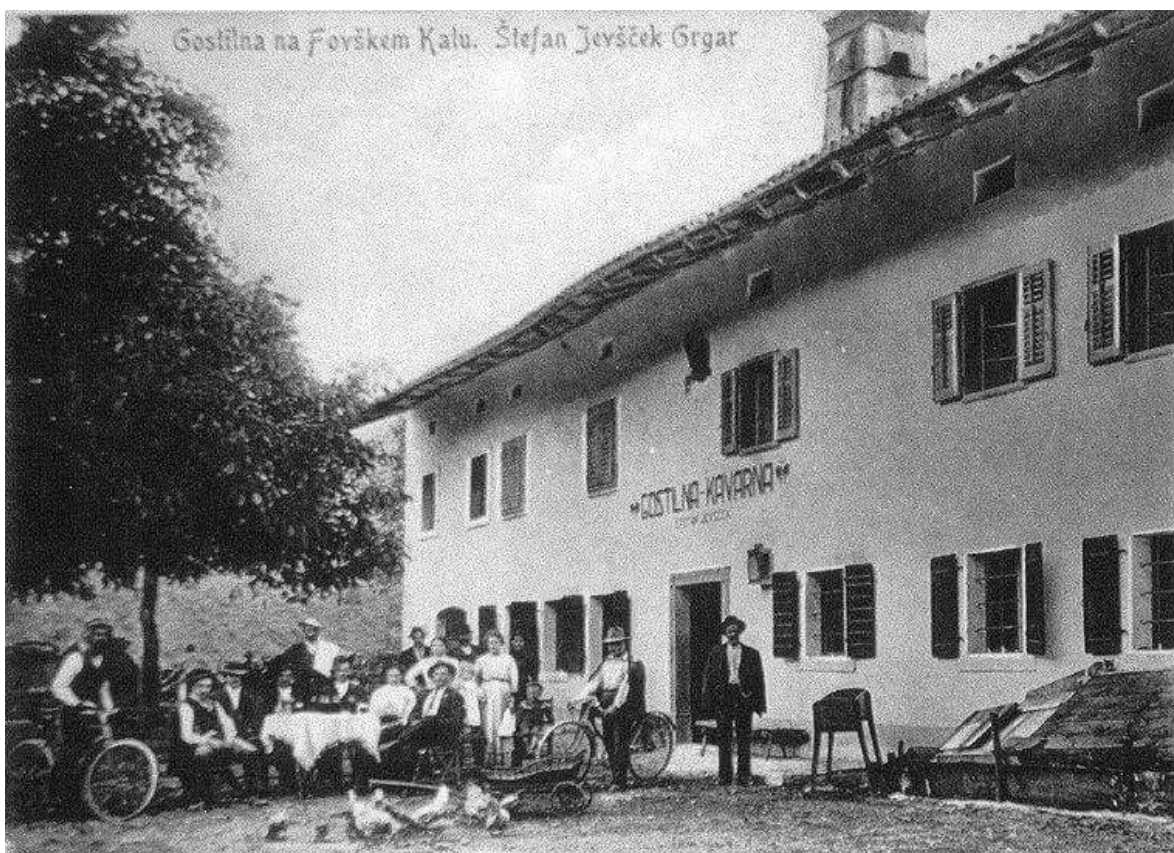
Slika 2: Hiša Grgar 196 po 1. svetovni vojni.

Pri graditvi objektov z resonančnim razmerjem stranic v pravokotniku ni potrebno graditi popolnoma natančno. Pri odstopanju za približno \pm 3 odstotke še vedno dosežemo enako duhovno moč. Objekt je imel teoretično največjo mogočo moč, moč prvega nastanka po tau.