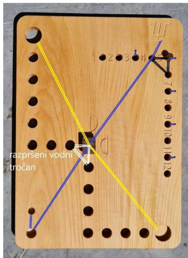
Slika 3: Povezave vseh potencialov s kačjimi črtami in pozicija klinov, ki omogoči največjo moč luninega koledarja.

Nekoliko večjo moč ima klin za luno, ko je v vogalni poziciji, na primer na lokaciji prvega in zadnjega krajca, kot je prikazano na sliki 3, kjer formira tročan, ki je na sliki 3 označen belo. V tem primeru se med klinom in obema luknjama oblikuje tročan. Klin ima potencial v znamenju vode, isti potencial imata tudi obe luknji, ki sta v trikotniku.