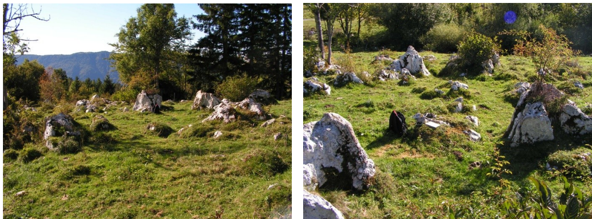
Slika 3: Levo, megalitski krog. Desno, v osrednjem delu slike, območje s štirimi kamni, s peto močjo v podsvetu .

V neposredni bližini mlekarne je megalitski krog , ki ga kaže slika 3. Z natančnim pregledom smo ugotovili, da je tudi v tem objektu dizajnirana moč, ki se vsebinsko dopolnjuje z mlekarno. Megalitski krog oblikuje devet skal, vsaka od njih tehta nekaj ton, razporejene pa so v krogu. Na zunanji strani krožnice so štiri skale, orientirane so glede na strani neba, kot kaže shematski prikaz celotne strukture na sliki 4.