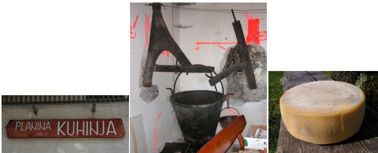
Slika 1: Planina Kuhinja s starim kotlom za kuhanje mleka in petomočni sir z žlahtno plesnijo.

Kot sem že v prejšnjih člankih napisal, izraz »peta moč« izhaja iz slovenske kulturne dediščine. S tem izrazom so naši predniki označevali najbolj žlahtno moč, s katero so se zdravili. Polje pete moči lahko uravnoteži vse sloje človekove avre, okrepi imunski sistem, ga naredi odpornega na škodljivo sevanje iz okolja, zviša človekove umske sposobnosti in okrepi intuicijo. Zdaj pa smo ugotovili, da ima peto moč tudi hrana. Uživanje takšne hrane okrepi vse telo, zdravilno deluje na vse organe v telesu in ne samo na prebavila. Peta moč pride s hrano neposredno v telo, potuje po energijskih meridijanih in se usmeri predvsem tja, kjer je telo šibko in ga tako okrepi.