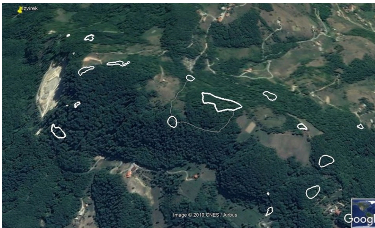
Slika 1: Lokacije megalitov na Žusmu s kamnolomom na zahodni strani hriba.

Že pred tem je lokalna organizacija Megaliti Žusma pripravila satelitski posnetek hriba z natančnimi lokacijami megalitov, kot kaže slika 1. Omenjenega dne si nismo ogledali vsega, smo pa razvozlati duhovne značilnosti območja.