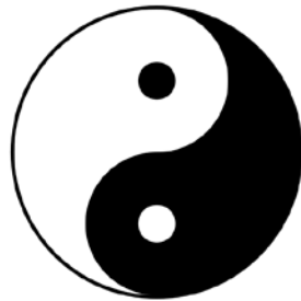
Slika 3: Sistem nasprotij jin-jang.

Pri raziskovanju megalitov še nikjer drugje nismo našli tolikšne moči v biopolju, kot je na vzhodnem in zahodnem delu hriba Žusem. Tam sta med seboj povezani dve območji, zelo slabo in zelo dobro, kar spominja na sistem nasprotij jin-jang iz kitajske klasične filozofije, slika 3. Bel in črn krogec v simbolu nam sporočata, da vsaka stran nosi v sebi tudi del nasprotne strani – belo polje vsebuje delček vsebine črnega polja in nasprotno. Natančno to smo ugotovili tudi mi pri terenskem ogledu gorskega masiva Žusem. Na najvišji točki njegovega zahodnega dela, ki je razpršen in škodljiv za ljudi, smo našli ozko območje z osredotočeno močjo, ki ljudem ni škodljivo. Gre za lokacijo, kjer stoji razgledni stolp. Tudi na vzhodnem delu hriba Žusem, kjer sicer ljudem polje ni škodljivo, smo odkrili podobno ozko lokacijo, vendar z razpršeno močjo, prav takšno, kot je na delu hriba, kjer je kamnolom. To ozko območje pa je ljudem škodljivo. Tam je parkirišče nad pokopališčem. Simbol jin-jang ponazarja naravne zakonitosti biopolja, znane že tisočletja.