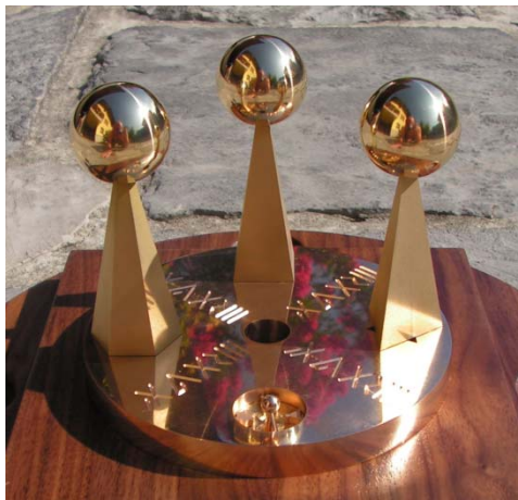
Slika 3: Regulator biopolja »Sončni disk«.

V članku Megalitski krog pod Krnom smo pisali, da se s pravilno postavitvijo piramid v regulator biopolja lahko zdravi bolezni, tako, da se izbriše entropija bolezni z enako, vendar nasprotno vrednostjo sintropije.