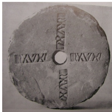
Slika 1: Venetski disk z napisi v Slovenščini, star približno 2500 let, je v Narodnem muzeju v Atestinu.