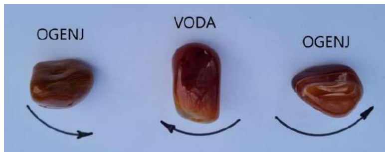
Slika 2: Vodni truj.

V zgornjem delu oblike dvojne sekire, slika 1, ki je tudi simbol 4 , so trije krogi, narisani skoraj v ravni črti. Ti krogi označujejo potenciale moči. Med drugim so posoški staroverci poznali tudi naravni sistem s tremi potenciali moči, razvrščenih v ravno črto. Imenovali so ga truj. S trujem se okrepi moč tistega potenciala, ki je v sredini, kot prikazuje slika 2.